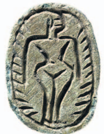
van boven naar beneden: Een handvat van een spiegel in de vorm van een naakt meisje. Afkomstig uit Egypte, in de tijd van de 18e dynastie (ca. 1530-1292 v.Chr.)

Een scarabee met een boomgodin. Deze is afkomstig uit Palestina/Israël uit de Midden-Bronstijd (ca. 1700-1550 v.Chr.).