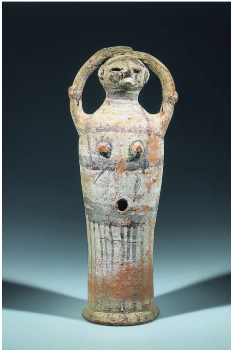
Weeklagende vrouw met opgeheven handen voor haar gezicht, afkomstig uit Midden-Egypte, uit ongeveer 2000 voor Christus. Haar functie blijkt uit de boven haar hoofd opgeheven handen. Dit soort figuren werd uitsluitend in graven aangetroffen. Uit Midden-Egypte, ca. 2000 v.Chr.

Meteen in de eerste zaal van de expositie worden vrouwenbeeldjes met erotisch geladen eigenschappen, positief neergezet. Ze zijn van voor het monotheïsme, toen godsdienst nog niet draaide om één God. In de tijd van het monotheïsme werd de vrouwelijke seksualiteit een bedreiging: in voorstellingen van de vrouw werd daarom het haar bedekt, eenvoudig en zonder opsmuk, zo gaat het verhaal in het Bijbels Museum. Anno 2013 roept het de vraag op of naaktfoto's in de Playboy soms ook vrouwvriendelijker zijn dan